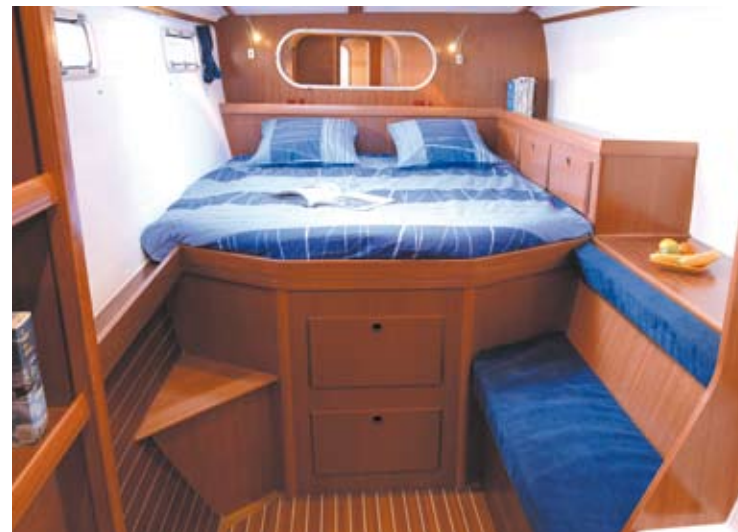
cabine propriétaire / owner cabin

La qualité des boiseries et des matériaux choisis fait du Nautitech 47 un véritable yacht .